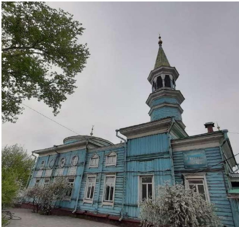
Сурет 1. «Бір мұнаралы Ағаш мешіттің» ғимараты. Семей. 2024 ж.

XIX ғ. екінші жартысында төртінші мұсылман махалласы Риза хазіреттің ұстаздығымен танылып, алыс-жақынға белгілі болған. Ол ұстаздық еткен медреседе шәкірттер саны жыл сайын артып отырған. Мысалы, 1870 ж. Риза хазірет медресесінде 60 шәкірт білім алса, жамағаттың саны, ерлер мен әйелдерді қоса есептегенде, 716 кісіге жеткен. Сол кездегі облыстық басқарманың Орынбор мүфтиятына жолдаған есебі бойынша, Риза хазірет діни істермен ресми түрде 1851 ж. бастап айналысқан, нақтырақ айтқанда, діни дәрежеге өтіп, қызметін жалғастырған: «Ризаутдинъ Валитовъ приходскій мулла, изъ мѣщанскаго званія, мечети №4. Съ какаго времени въ духовномъ званій – 1851 г. (БРҰА. Қ.295. Т.3. Іс.7466. П.6).