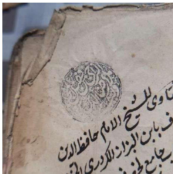
Сурет 6. Мөрдің бедері. Қағаз бетінде 2×2 см аумағында басылған.

Кітаптың форзац беттерінің бірінде мөрдің бедері мен еңбек туралы қысқаша анықтама жазылған (сурет 6). Мөрдің бедеріндегі жазу: « Әр-ражи мин фазл әл-Мәжид, молла Ризаетдин бин Уәлид, 1278 » (М. Насыровтың далалық материалдары, 2024). 1278 ж. 1861/62 ж. сәйкес келеді. «Ұлы Жаратушының сеніміне жүгінген, молда Ризаетдин бин Уәлид» ұғымындағы жазу сол кездегі мөрлерге тән құбылыс. Мөрдің бұл бедері Риза хазіреттің Семейдегі қызметін зерттеуге қосатын деректердің бірі ретінде негізге алынып отыр.