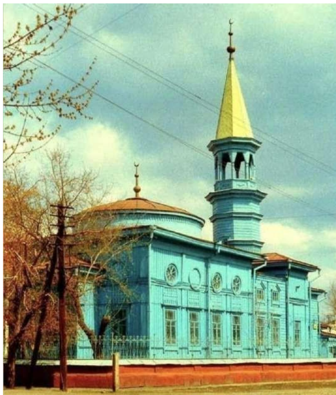
Сурет 2. Семейдегі №4 мешіттің орнына 1907-1910 ж.ж. салынған жаңа мешіттің келбеті.