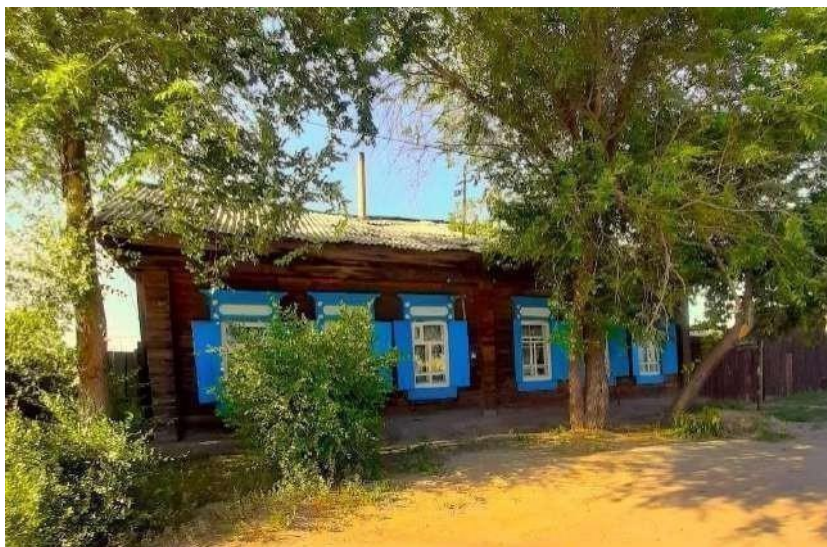
Сурет 4. Байырғы медресе ғимараты.

Семейдегі №4 мешіттің 1847 ж. салынғанын және Абайдың оқу жылдарын осы діни орталықпен байланысты болғанын болжасақ, онда бұл арқылы ақынның білім алған медресесі өзінің бастапқы қалпын сақтап, бүгінгі күнге дейін жеткен деген ғылыми болжамға да келуге мүмкіндік бар. Дегенмен ғимаратқа қатысты архивтік деректерді мақаланы жазу барысында кездестірмеуімізге байланысты бұл сұрақ ашық қалып отыр.